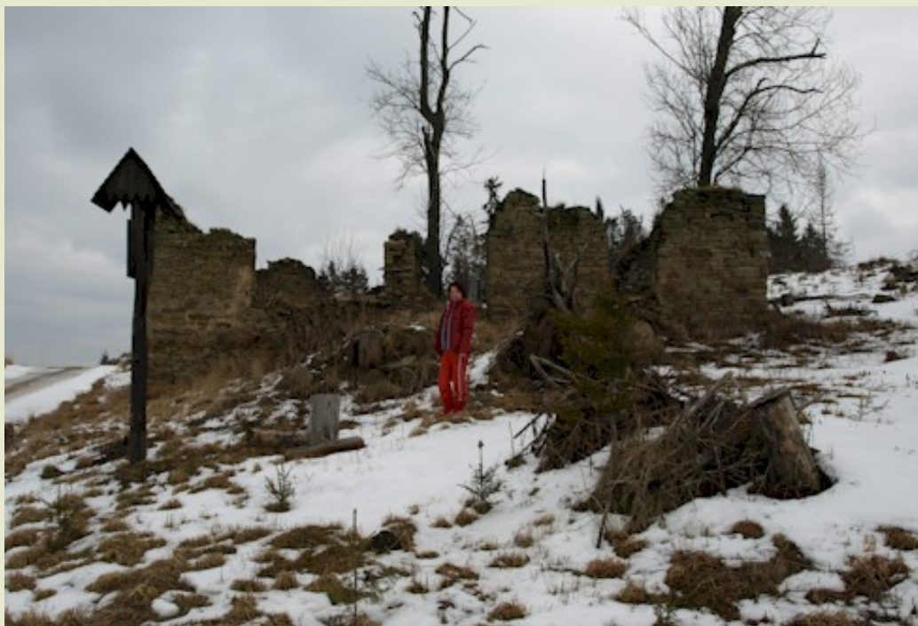
Pri pozostatkoch „Corneliusovej chaty“